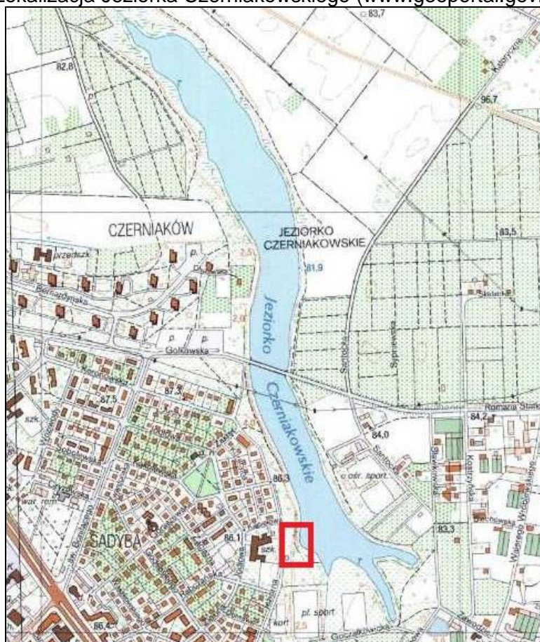
Rysunek nr 1. Lokalizacja Jeziorka Czerniakowskiego (www.geoportal.gov.pl)

Przedmiotowe kąpielisko na Jeziorku Czerniakowskim z lokalizowane jest przy ul. Jeziornej 4, sąsiaduje ze Szkołą Podstawową nr 103 i Klubem Sportowym Delta, z boiskami sportowymi oraz niską zabudową jednorodziną i wielorodziną.